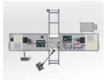
输入端（右）、输出端（左）布局图 长= 5600 mm | 宽= 1100 mm