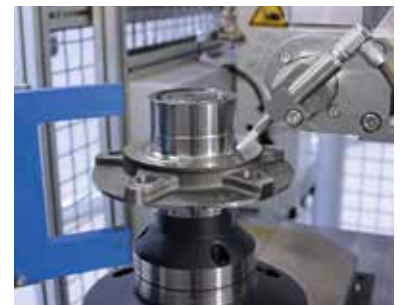
Rissprüfung von Radnaben mit Zusatzfunktion der Lochzählung durch eine Lichtschranke