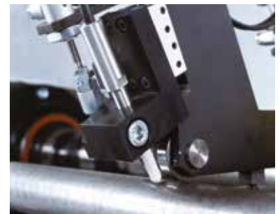
Zuverlässige 100%-Prüfung auf oberflächenoffene Beschädigungen von Wellen