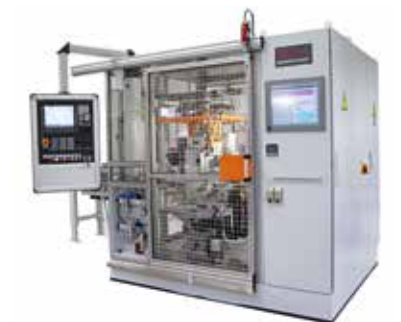
Vollautomatische In-Line Rissprüfanlage